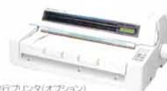
伝票発行プリンタ(オプション)

今、お使いの伝票・帳票の印刷はもちろんのこと、ハガキや封筒、送り状なども簡単かつスピーディに対応します。