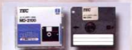
▲TEC JC FLOPPY DISK MD-2100-10

外部記憶装置には3インチフロッピーディスクを採用。しかも、データ処理を高速化するため、RAMディスクを搭載しました。振動や衝撃などの影響を受けない、高速で信頼性の高いデータ処理を実現します。